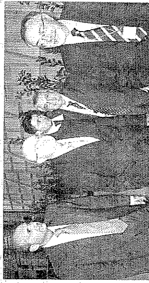
Papigno Sono iniziati i lavori del XIII Congresso Internazionale sull'archeologia industriale promosso dal International committee for the conservation of the industrial heritage (Ticcih) Malagoli

Presentazione ufficiale ieri pomeriggio negli studios di Papigno dei lavori del XIII Congresso