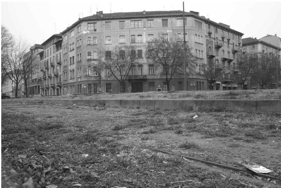
Foto 5. La manifattura meccanica.

EX- LANIFICIO COLONGO, nei cui fabbricati in via di ristrutturazione troveranno sede la Film Commission del Piemonte e servizi per l'industria cinematografica.