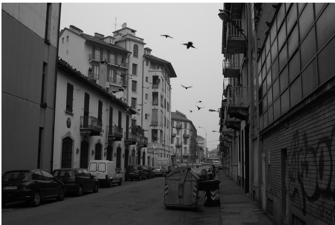
Foto 6. Il Birrificio Torinese, ospitato all'interno di una vecchia industria alimentare.