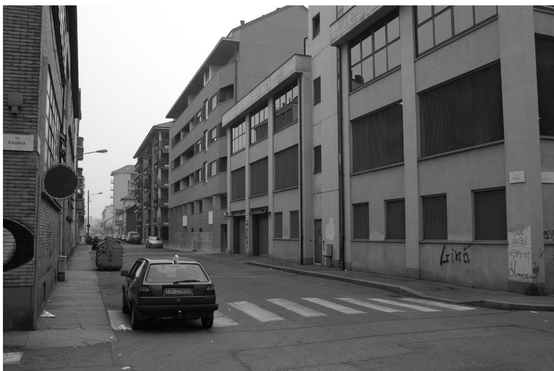
Foto 1. Scorcio tra le Vie Parma e Modena .

All'interno del borgo convivono oggi una molteplicità di tipologie e funzioni a cui corrisponde una immagine varia, per figure, altezze e dimensioni, ma ancora strettamente legata al passato industriale, che richiama e sollecita nuove modalità di uso e di vita: loft per uffici ed abitazioni, centri di ricerca e di commercio in stabilimenti riadattati, un birrificio artigianale in una vecchia fabbrica di alimentari, un teatro sperimentale, ecc.