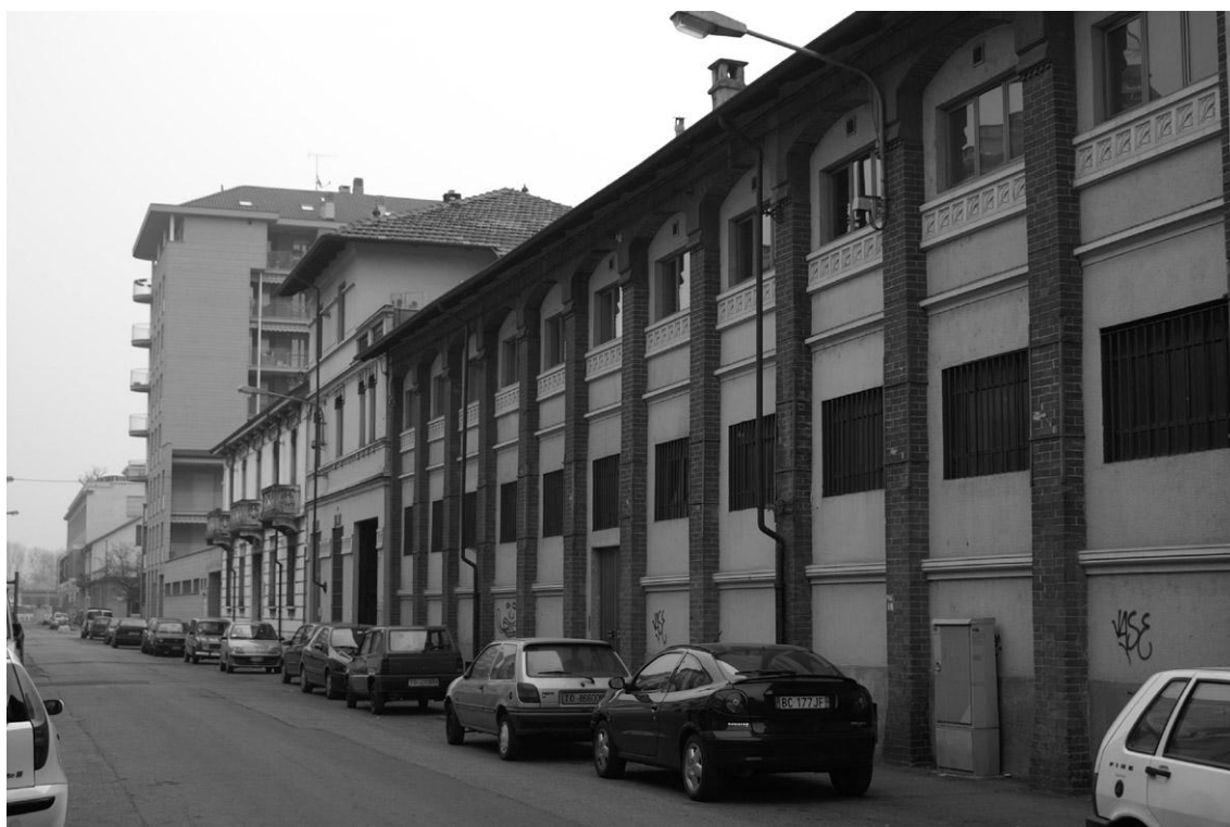
Foto 2. Scorcio di Via Perugia

dai profili dei viali, che attraverso interventi di sostituzione edilizia non compatibili con il contesto per tipologia e linguaggio.