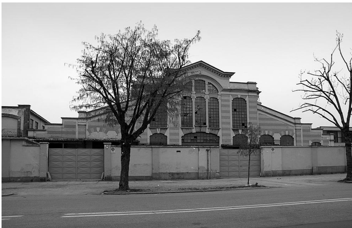
Foto 3. L'edificio centrale delle ex-Fonderie e Smalterie Ballada

L'isolato nella quale è inserita, che ospitava le residenze, gli uffici e parte delle officine, è stato in gran parte ristrutturato con un'intelligente operazione di recupero, mentre sull'edificio contenente la fabbrica vera e propria non è ancora stato effettuato alcun intervento né, ad oggi, ospita funzioni.