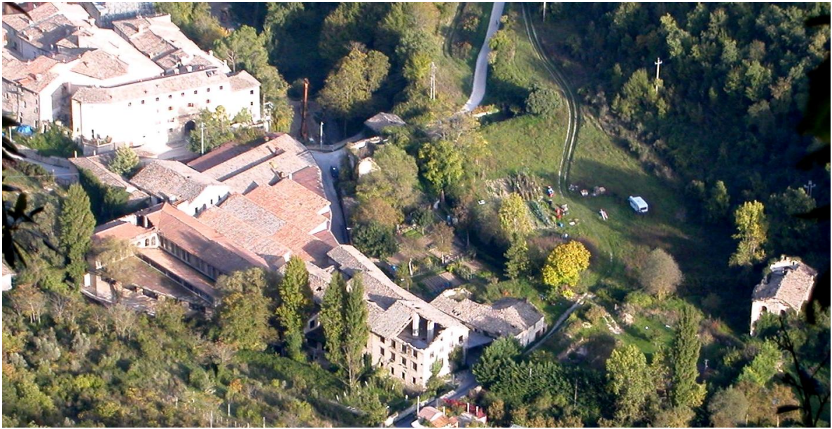
La concerria e la cartiera (più isolata a destra) di Esanatoglia (Mc)