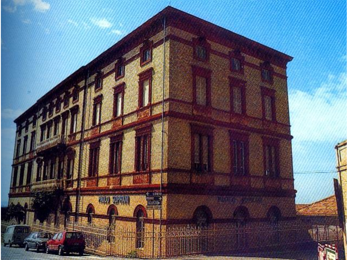
Sede della ditta Paolo Soprani a Castelfidardo (An)