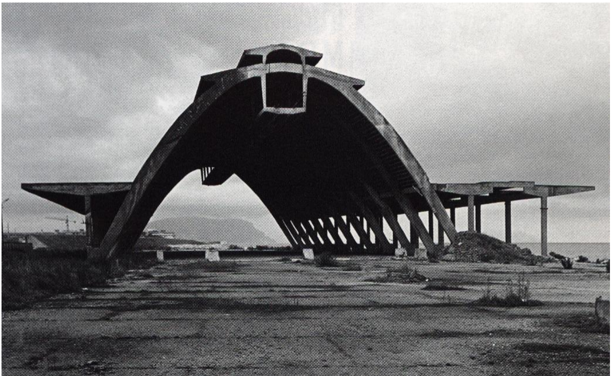
Capannone Montecatini a Porto Recanati (Mc)