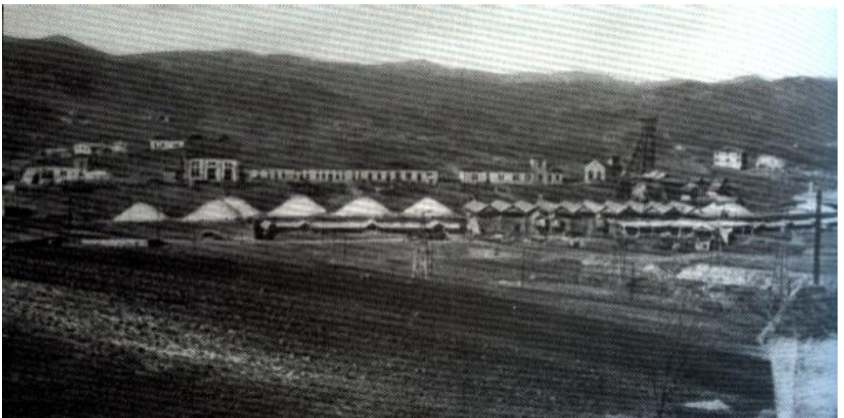
Il cantiere Certino a Peticara agli inizi del secolo (Pu)