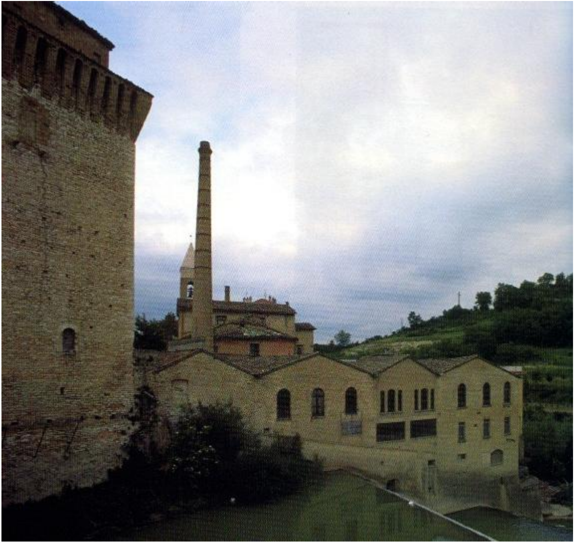
Il lanificio Carotti a Fermignano (Pu)