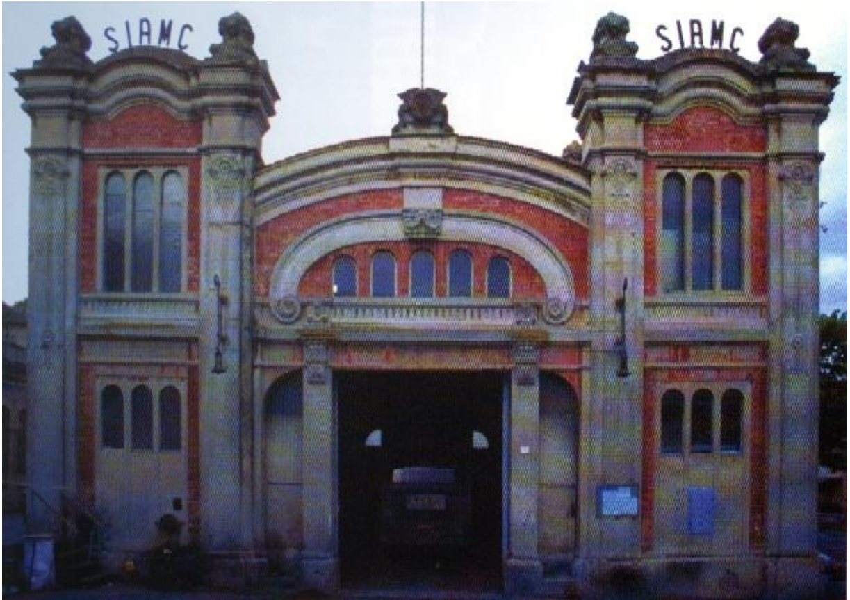
Autopalazzo Siamic a Corridonia (Mc)