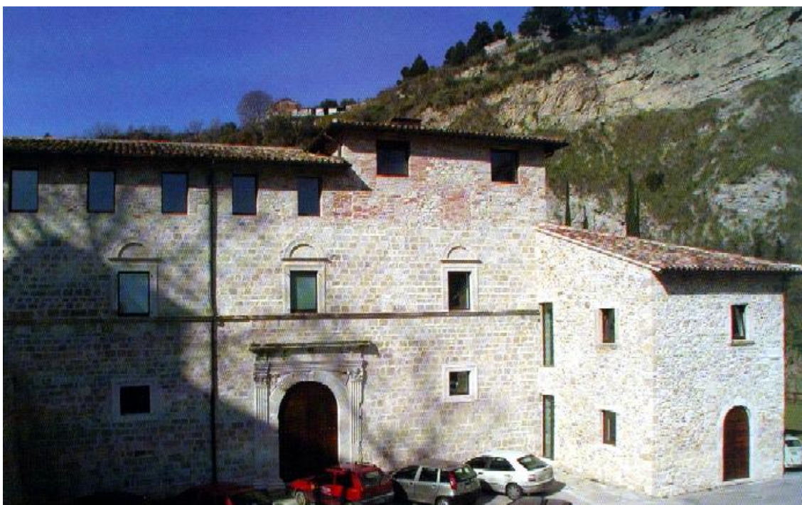
L'Opificio di Porta Cartara ad Ascoli Piceno (Ap)