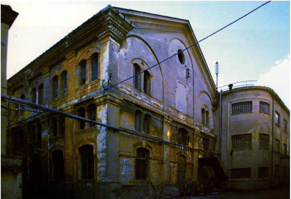
La cartiera Miliani a Fabriano (An)