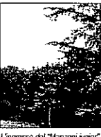
L'ingresso del "Manzoni junior"

TERNI - Sabato prossimo, a partire dalle ore 16, il Manzoni Junior dedica una giornata ai più piccoli organizzando nella sede di Via Mirimao presso il Circolo della Scherma la festa "La fabbrica delle bolle". Nell'occasione, prevista per festeggiare la fine della scuola dell'infanzia ed illustrare il programma dei campus estivi del Manzoni Junior, i genitori potranno informarsi con le animatrici addette dei laboratori previsti dal 15 giugno al 9 settembre 2006. Molti, infatti, i laboratori che si attiveranno: "Giocare con lo Sport", per consentire ai ragazzi lo svolgimento di un'attività fisico-sportiva che valorizzi la "cultura e il gusto del gioco", promuovendo la capacità di comunicare, collaborare e interagire nel rispetto degli altri e delle regole; "Io e l'argilla", giochi con materiali manipolativi per indurre il bambino a scoprire ed esercitare la propria creatività; "Ritratto d'autore", laboratorio manipolativo-artistico per sviluppare la creatività personale e il senso artistico. Tante bolle, tanto divertimento, e un simpatico omaggio per tutti i bambini che parteciperanno alla festa.